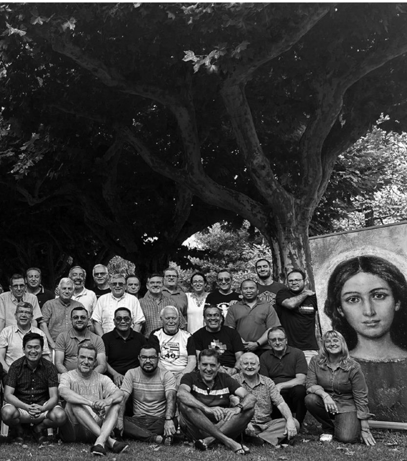
Comunidad capitular - Luján 2024